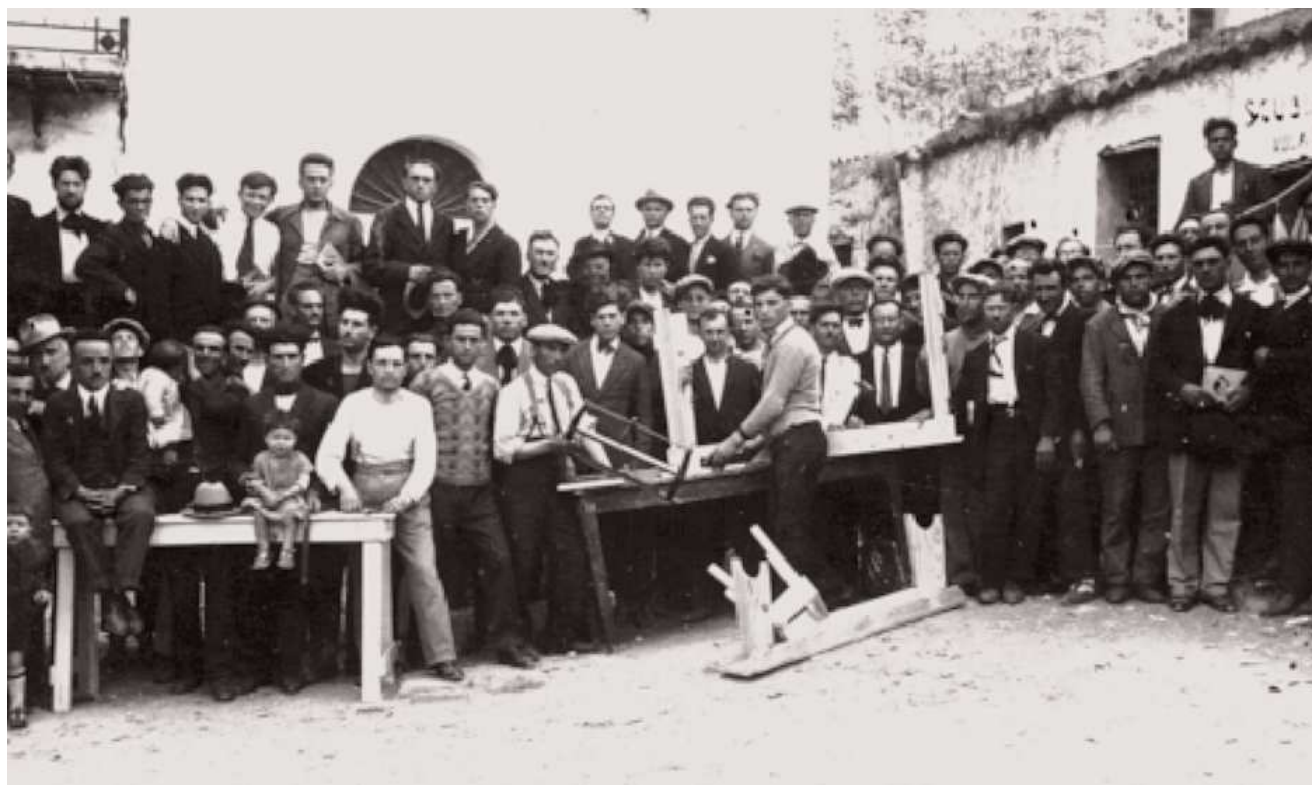
Ustica aprile 1927. L'inaugurazione della nuova scuola con tre aule sulla piazzetta Largo Maddalena. In primo piano i falegnami ostentano gli attrezzi con cui hanno realizzato gli arredi.

I confinati passavano gran tempo nella piazza dove «...fabbricavano le chiacchiere. Come facevano? Prendevano una ventina di parole: condono, ricorso, sussidio, proscioglimento, Lipari, Ponza, Palermo,