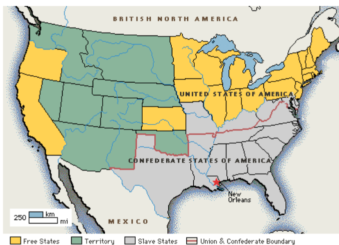
Map of US during civil war.

New Orleans all'epoca era la più grande città portuale a sud dello stato della Louisiana, che si schierò con gli altri Stati della Confederazione. Nel 1860 in New Orleans circa il 40% della popolazione era nata all'estero, la città del sud con la maggiore percentuale di immigrati 1 . Molti erano irlandesi, tedeschi, francesi ed inglesi. A quel tempo gli italiani non erano più dell'1% del totale della popolazione, ma, come gli altri gruppi stranieri procedettero a formare piccole compagnie