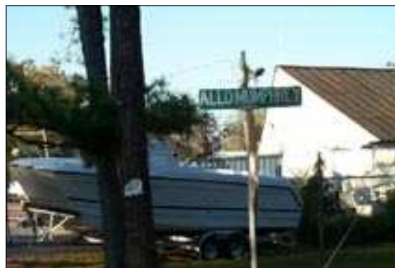
Munphrey (Manfré) Lane.