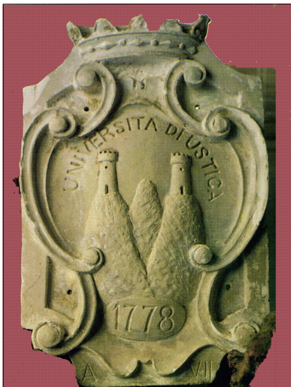
Lo stemma del Comune. L'erezione a Comune è avvenuta nel 1771 e non nel 1778 come erroneamente indicato in questa riproduzione del 1929.

The coat of arms of the Commune. The status of Commune was accorded in 1771 and not in 1778 as this reproduction wrongly shows.