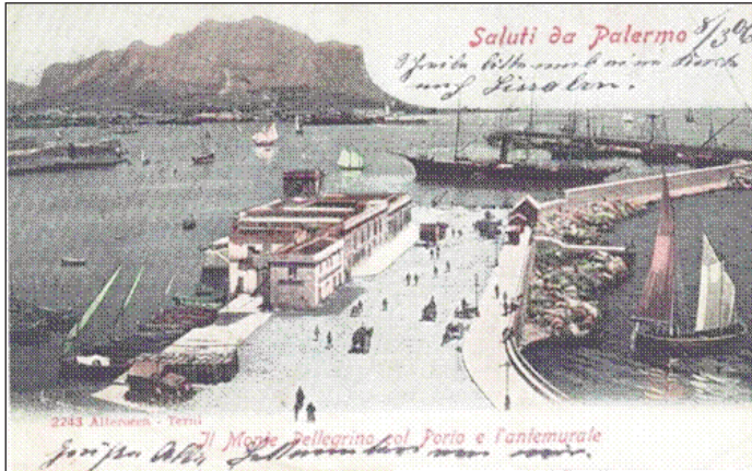
Palermo Harbor Postcard, 1906 (the masted ship in the background is very similar to the Vincenzo Florio ).

Cartolina: Golfo di Palermo, 1906 (sullo sfondo, una nave con albero molto simile al Vincenzo Florio ).