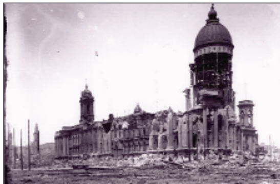
San Francisco City Hall.

In the spring of 1906 a series of strong earthquakes (terramoti) began to rock the small island community of Ustica. Following some particularly strong initial quakes, most