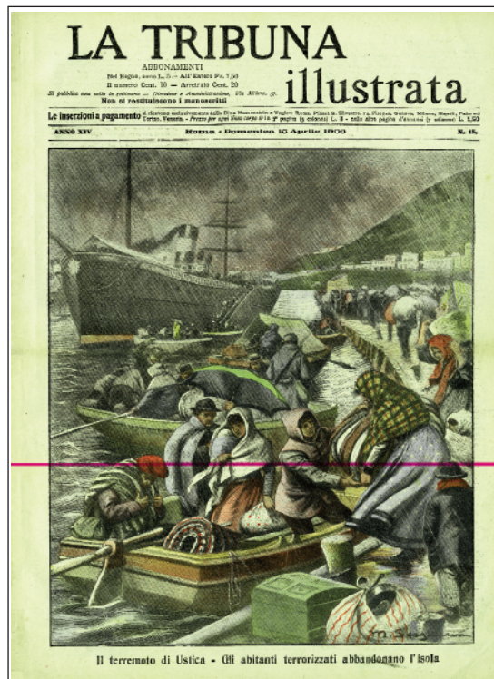
The Evacuation of Ustica, 1906.

As she was making final preparations to embark from the port of Palermo on April 20,