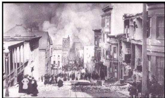
San Francisco Burning.