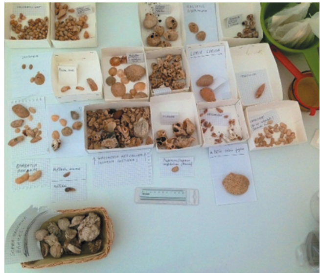
Una parte dei fossili raccolti alle pendici meridionali della Falconiera nell'ambito della campagna di ricerche sui livelli Tirreniani a Ustica avviata dal nostro Centro Studi durante l'estate 2012.