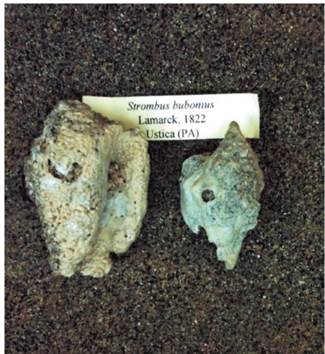
Primo piano di uno Strombus bubonius usticese esposto in una vetrina del Museo Gemellaro di Palermo. Si tratta di un gasteropode che attualmente vive nelle coste occidentali dell'Africa Tropicale ma che durante il caldo Tirreniano (circa 100.000 anni fa) si era spinto nel Mediterraneo. Viene considerato il capofila dei fossili-guida di quel tempo.