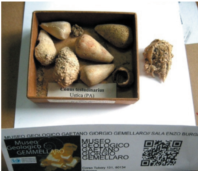
I fossili raccolti a Ustica nella seconda metà degli anni '60 e oggi custoditi al Museo Gemellaro di Palermo, corso Tukory, 131.

E' motivo di grande soddisfazione vedere che alcuni dei più belli esemplari della malacofauna usticese sono valorizzati in esposizione permanente nelle vetrine del Museo, quotidianamente visitato da studiosi, scolaresche e turisti.