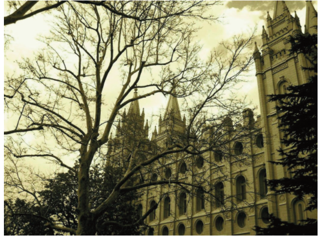
Il tempio mormone di Salt Lake.