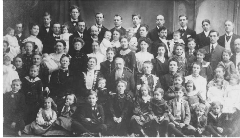
Joseph F. Smith, fondatore della Chiesa Mormone, con la sua famiglia.