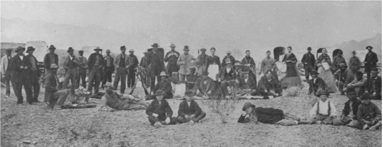
Brigham Young e i compagni. 1870. Brigham Young and company. 1870.