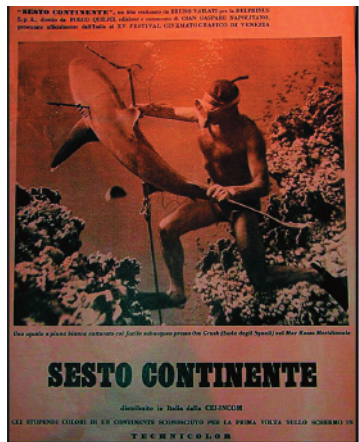
La locandina del film Sesto continente.