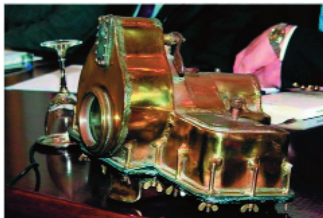
La prima cinepresa subacquea.